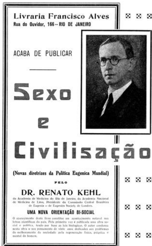
Figura 1 – Folheto de propaganda do livro publicado em 1933